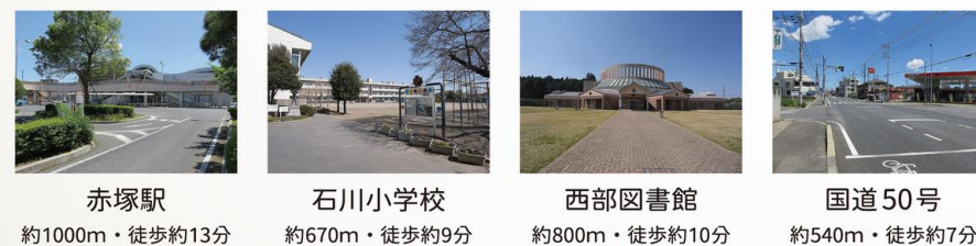
赤塚駅 約1000m・徒歩約13分 石川小学校 約670m・徒歩約9分 西部図書館 約800m・徒歩約10分 国道50号 約540m・徒歩約7分